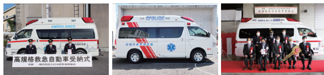
一般社団法人 日本損害保険協会 寄贈 日向市消防本部 (宮崎県) アステラス製薬株式会社 寄贈 四国中央市消防本部 (愛媛県) 一般社団法人 日本自動車工業会 寄贈 総社市消防本部 (岡山県)

寄贈を受けた消防本部からは「円滑な救急業務の遂行にあたり、高規格救急自動車の寄贈は大変ありがたい」など、寄贈元団体への感謝の言葉が寄せられており、高規格救急自動車を寄贈いただくことは、救急業務の高度化、救急業務体制の充実に大きく寄与しているものと誇っています。